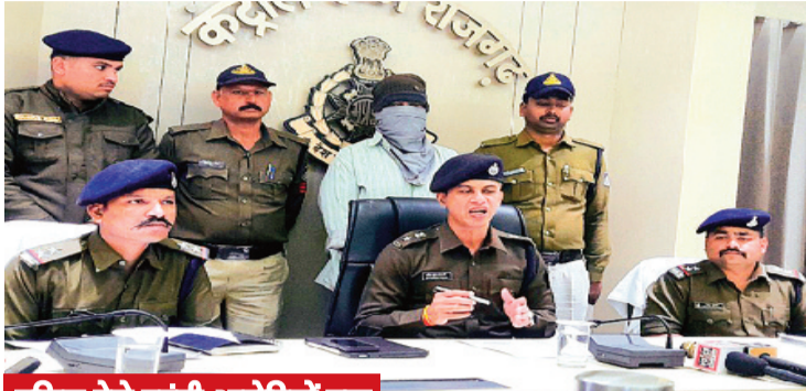
पुलिस ऐसे पहुंची आरोपियों तक